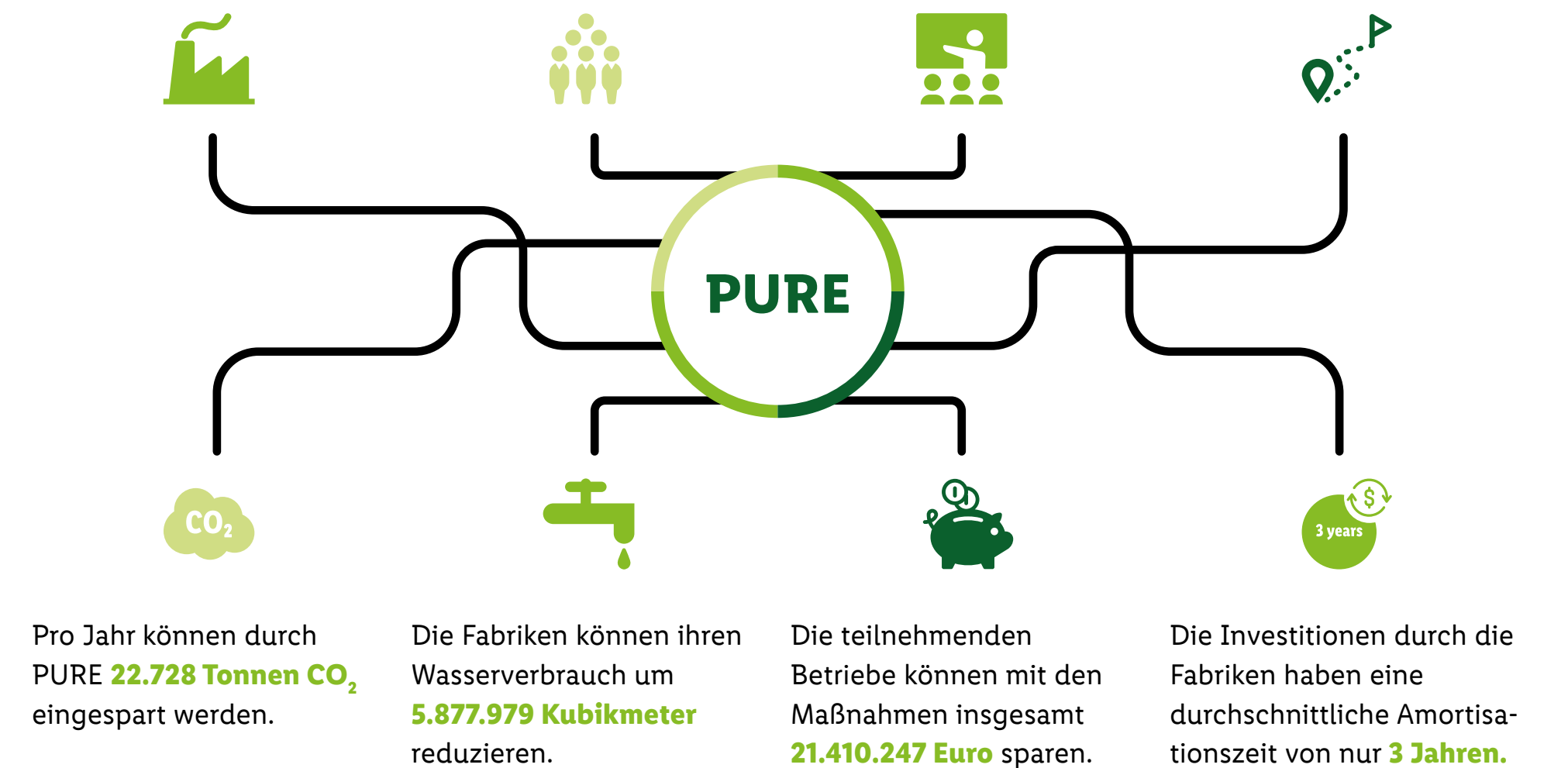
Abbildung 6: Wirkung in Zahlen

In einzelnen Fällen können über 20 % an Energiekosten eingespart werden.