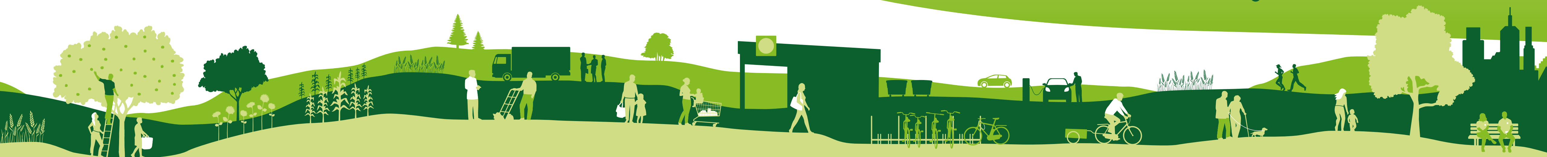
Abbildung 1: Detox Compliance Roadmap 2015–2020