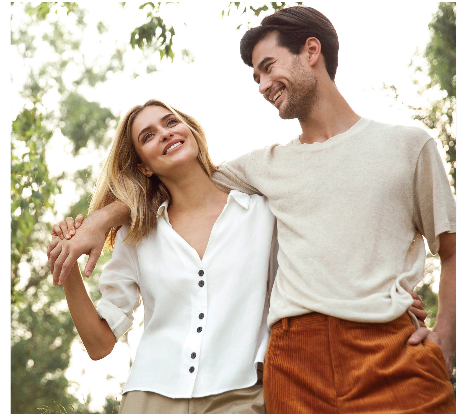
Textilien aus LENZING™-ECOVERO™-Fasern.

Eine weitere nachhaltigere Faser in Textilien für Lidl ist recyceltes Polyester nach dem Global Recycling Standard (GRS), das künftig vermehrt eingesetzt werden soll.