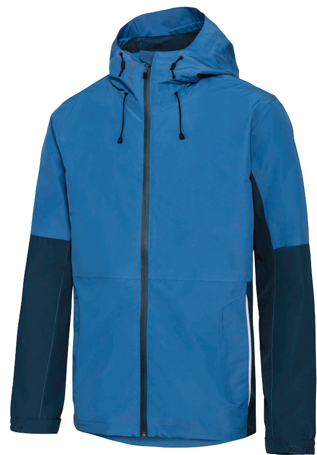
Textil mit BIONIC-FINISH® ECO

Gefährliche Chemikalien durch umweltschonendere und für die menschliche Gesundheit unbedenkliche Substanzen ersetzen – das ist unser Ansatz. Seit vielen Jahren gibt Lidl dafür Fallstudien in Auftrag. In Zusammenarbeit mit Chemikalienherstellern, Instituten und Labors sowie mit unseren Produktionspartnern testen wir neue Technologien und führen sie in den Fertigungsprozessen für Textilien und Schuhe aus unserem Eigenmarkensortiment ein.