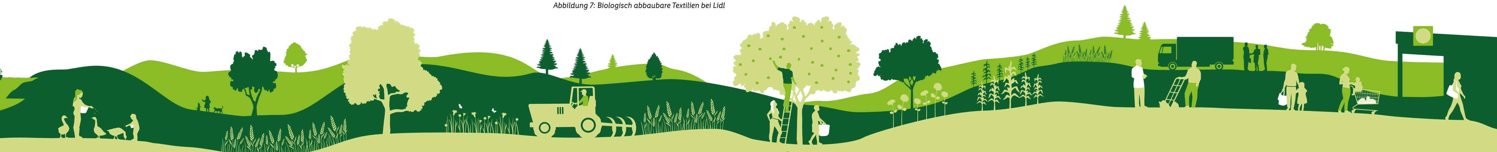
Abbildung 7: Biologisch abbaubare Textilien bei Lidl